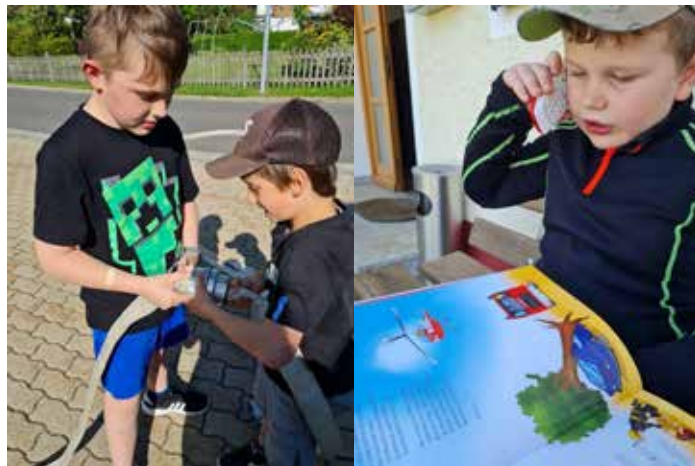
Teamarbeit beim Kuppeln