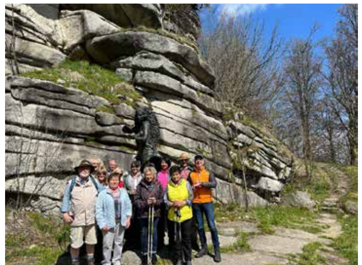
Zum Marktrechwitz Haus führte die jüngste Seniorenwanderung des FGV