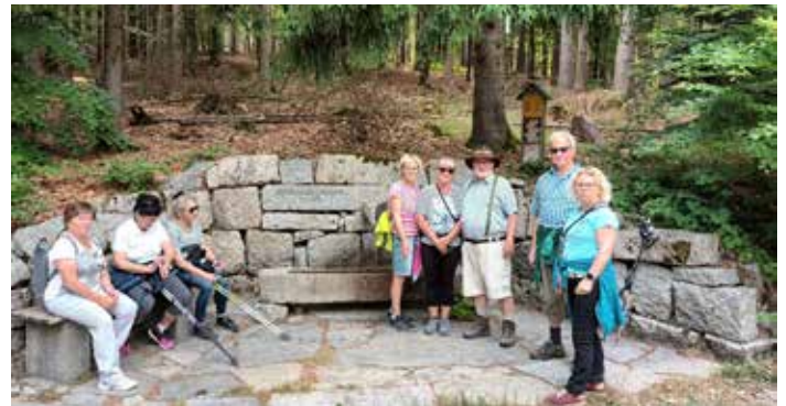
Am Zinnenbrunnen in Ölbrunn wurde kurz gerastet.