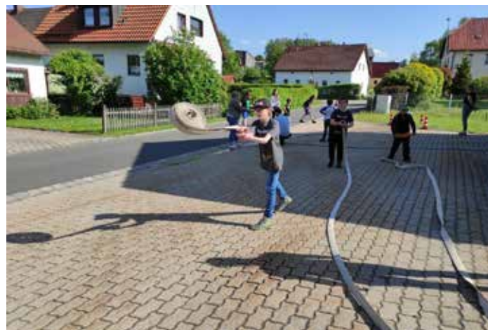
C-Schläuche müssen ausgerollt werden